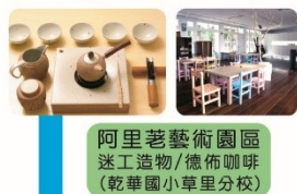
阿里茗藝術園區 迷工造物/德佈咖啡 (乾華國小草里分校)

新北市石門區乾華里小坑12號。 使用GPS請兩段式定位，先定位至台電核一廠再定位至乾華國小。 (E 25.286747, N 121.587753) (25°17' 12.29"N, 121°35' 15.91"E)