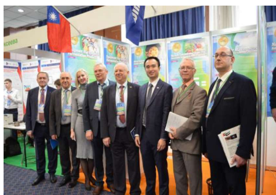
▲ 當地廠商蒞臨台灣展區洽談合作