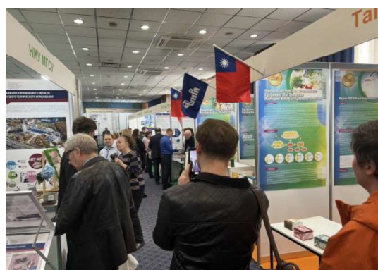
▲ 主辦單位特地為WIIPA與TIPPA團隊安排在最明顯的國際展區