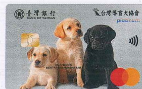
▲一卡通導盲犬認同卡